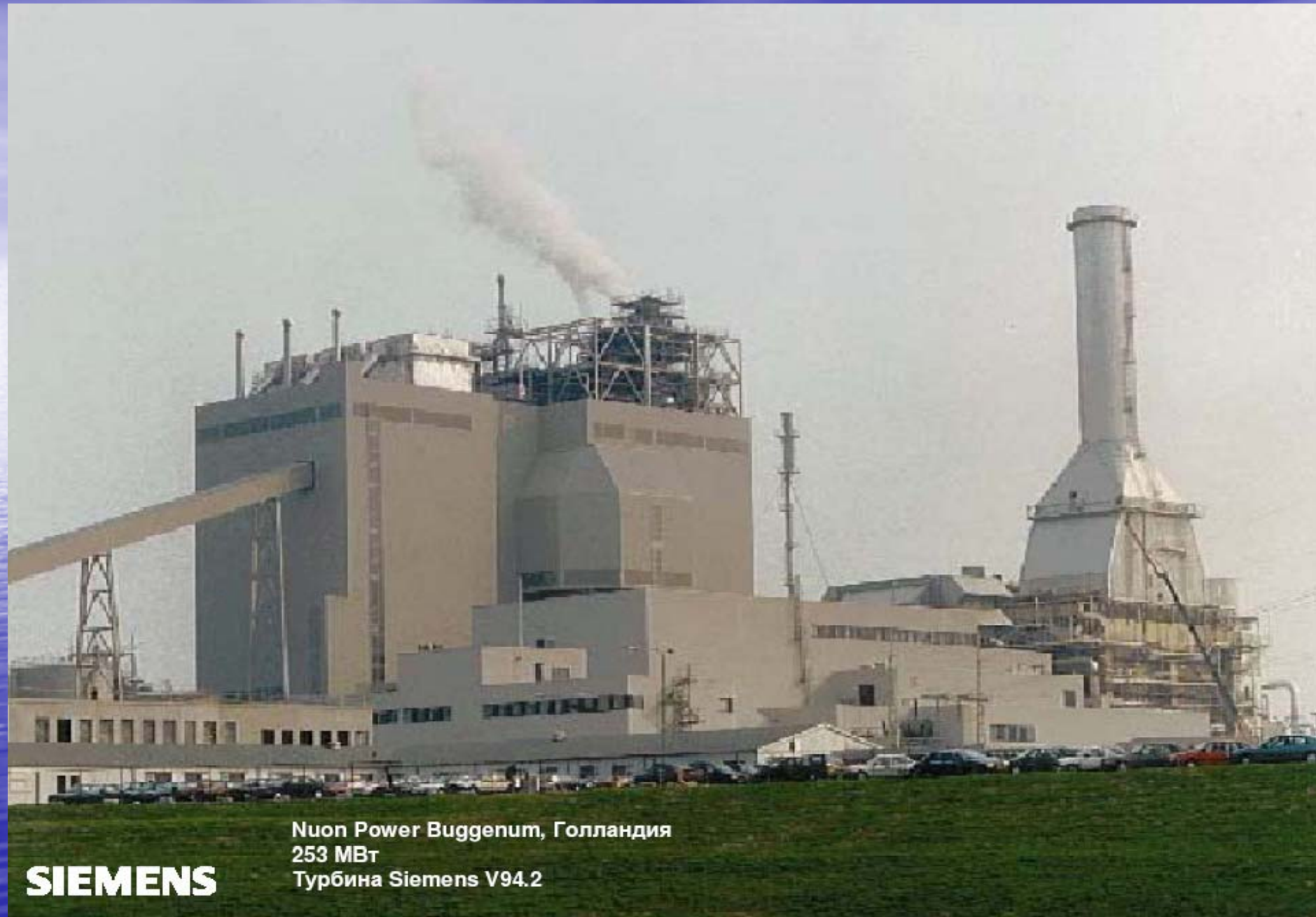
Нуон Power Буггенум, Голландия 253 МВт Турбина Siemens V94.2