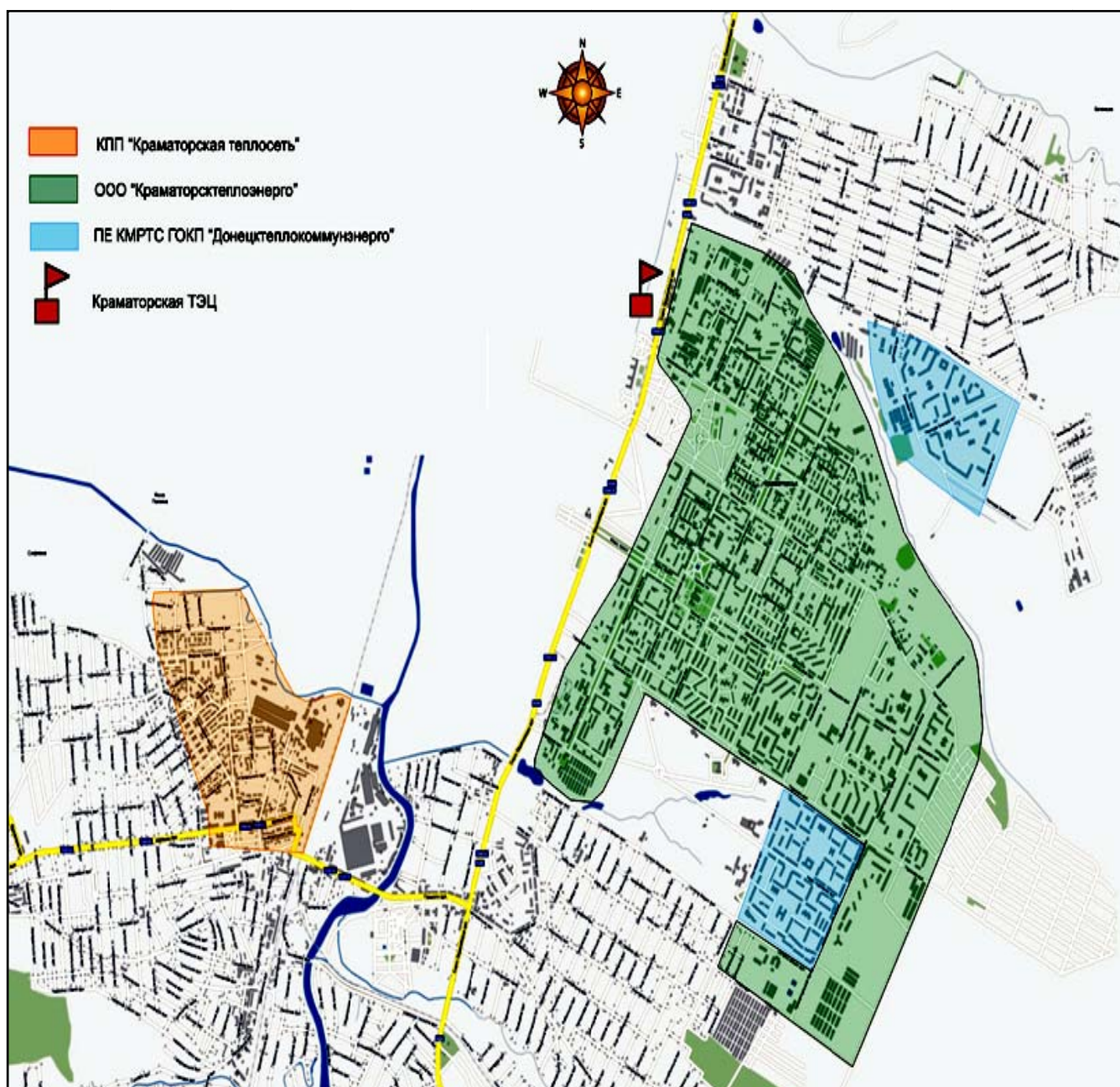
Рисунок 1.2. План Краматорска с выделением тепловых районов.

На рисунке 1.2 представлен план Краматорска с выделением тепловых районов по зонам обслуживания теплоснабжающих компаний.